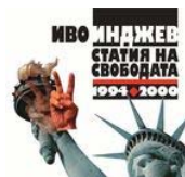
Мълчанието е злато